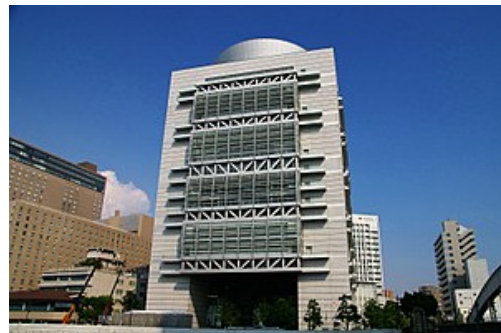
大阪府立国際会議場