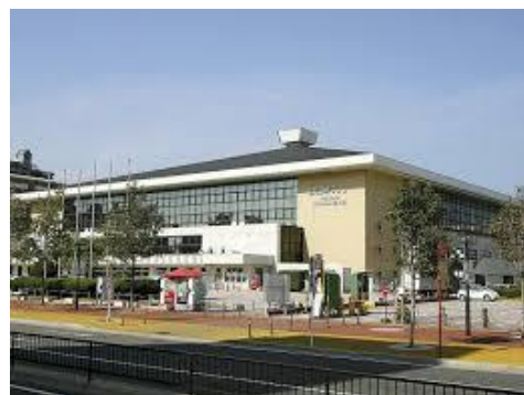
福岡国際センター