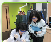
インターン実施風景