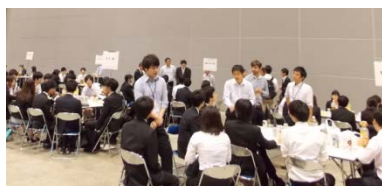
イブニングカフェ