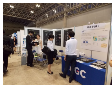
機器+キャリアカフェ併設ブース