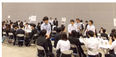
イブニングカフェ